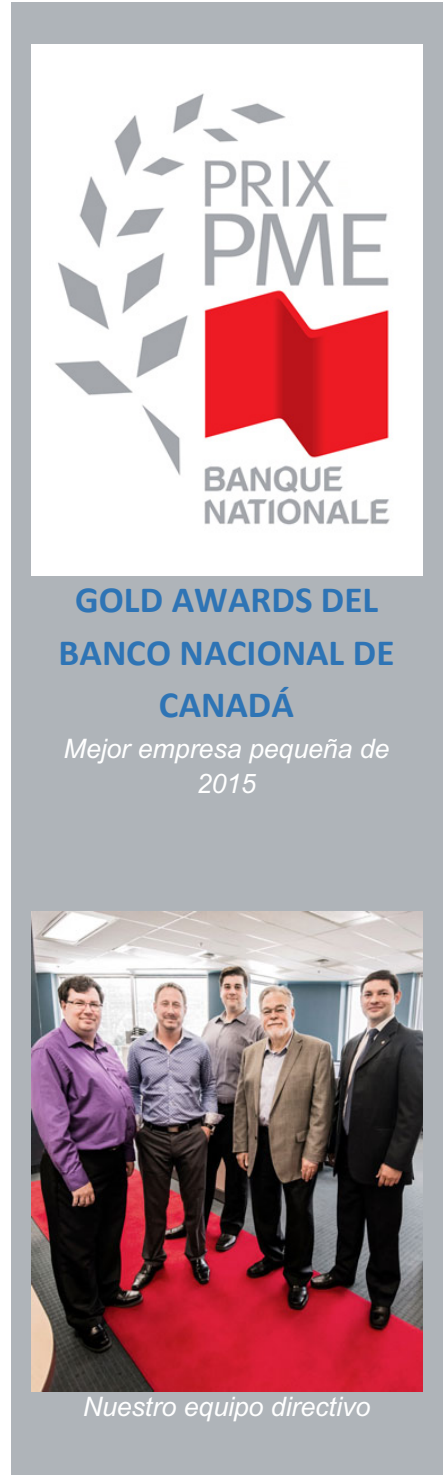
Nuestro equipo directivo